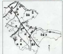
「中学校社会科副読本」から

そこで、「不毛地開墾等の業を以って、広く窮民に生産を与え候より他無之、先進国より手始めとして、下総国小金佐倉等の原野開墾」(明治二年民部省開墾局・東京窮民無産者御所置大意)とあるように原野開墾を開始しました。明治三年開墾着手順に十三の村名が立てられ、豊四季は第四番目、十余二は第十二番目としての村名です。四季豊かに稔れとした村名、十二分の発展を未来にかけた村名は、それぞれ当時の人の願望であり、明日への悲願がうかがえます。