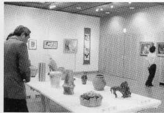
↑オープニング 展示