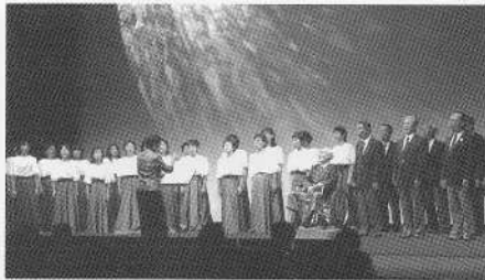
↑オープニング コーラス