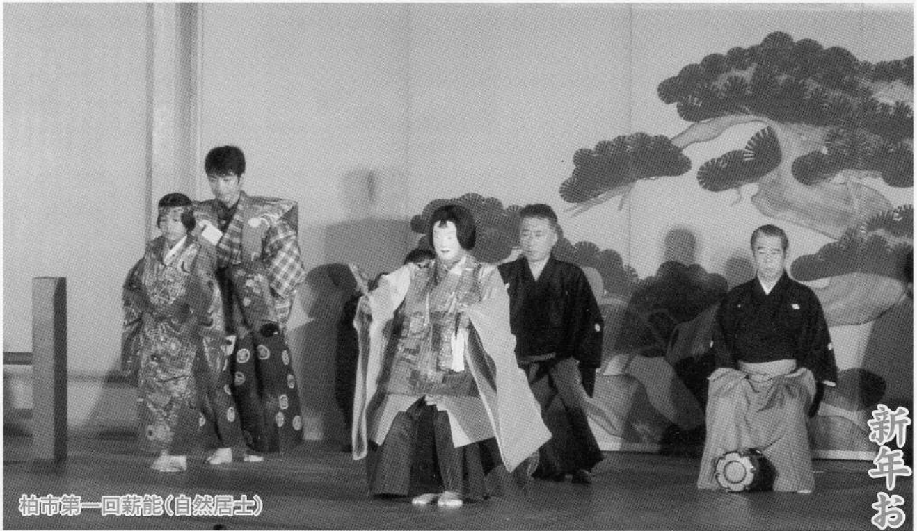
柏市第一回薪能(自然居士)

発行：柏市文化連盟／編集：柏市文化連盟広報委員会／事務局：柏市新富町1-3-31 浅野正子方 ☎04-7146-7234