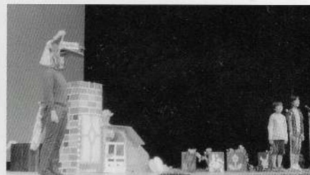
↑洋舞演劇 文化会館大ホール