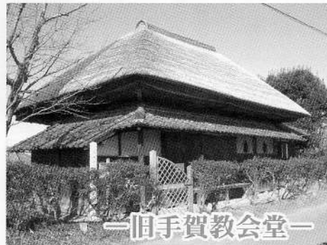
一 間手賀教会堂 一

明治12年に手賀教会が設立されました。この教会堂は明治16年に設置されたもので、現存する首都圏内の教会堂としては最古のものです。現在の保管されている聖画は明治の洋画家山下りんの手によるものです。