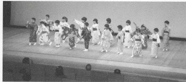
←文化祭 アミューゼ柏クリスタルホール 邦楽部門